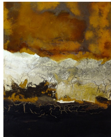
Abbildung: ruhtEva Karl

Die Artothek ist ein Projekt in Kooperation mit dem Kunstverein Bayreuth e. V. und der Roten Katze e. V.